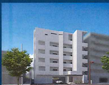
完成イメージベース(外観)

住宅地として人気の高い水前寺の土地を活かし、自宅に賃貸を併用しました。最上階のワンフロアの自宅では41畳のLDKや13畳あるテラスは圧巻。賃貸部分は周辺物件との差別化を図り、2LDKにも関わらず専有面積は85㎡。20畳のLDKにはウォークインクローゼットを備え、水周りもゆったり過ごせる高級仕様で2タイプの間取りをご覧ください。建物の外観は施主様が好きなコンクリートの打放しの空間が広がります。ぜひご来場ください。