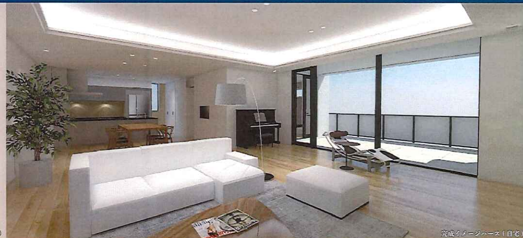
完成イメージベース(自宅)