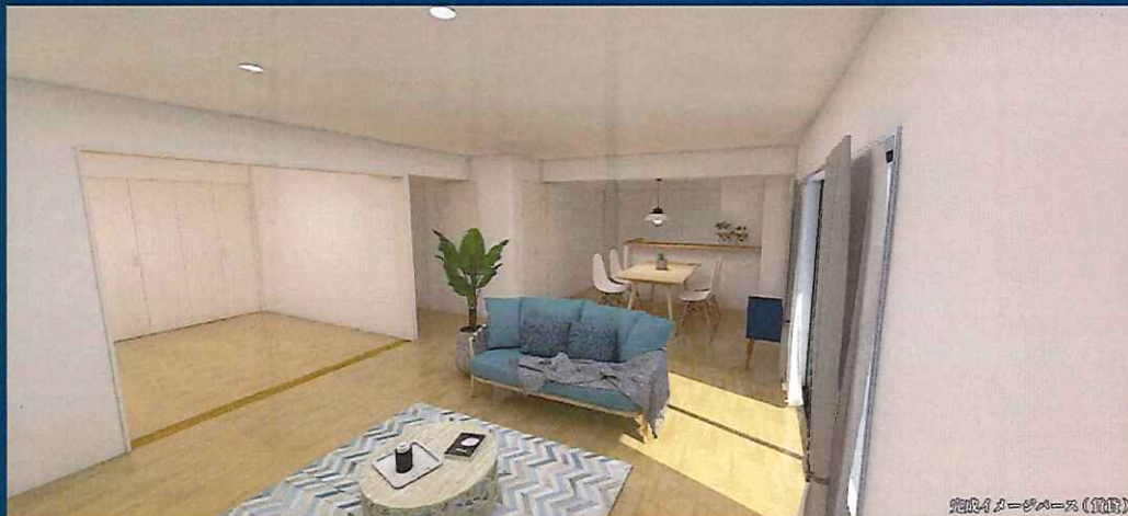
完成イメージベース(賃貸)