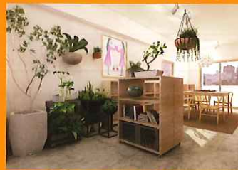
グリーンが趣味の方の部屋