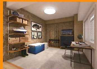
釣りが趣味の方の部屋