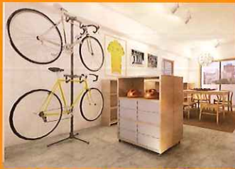
ロードバイクが趣味の方の部屋