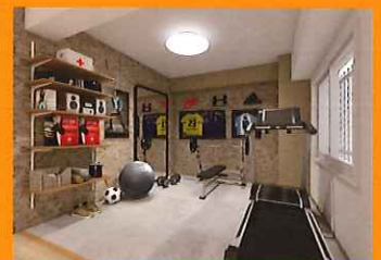
スポーツが趣味の方の部屋