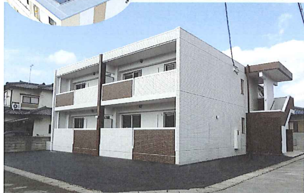
鉄筋コンクリート造 太陽光賃貸マンションに建替え！